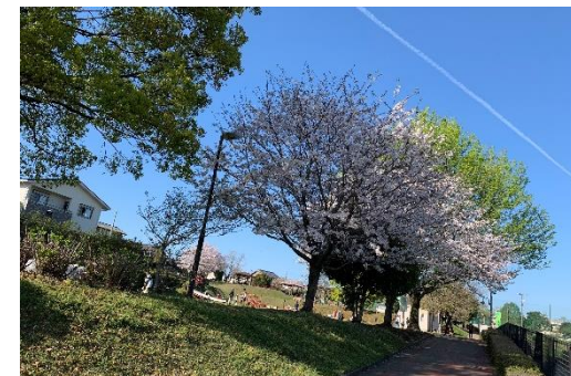
山ノ内グループホーム近くの山ノ内中央公園