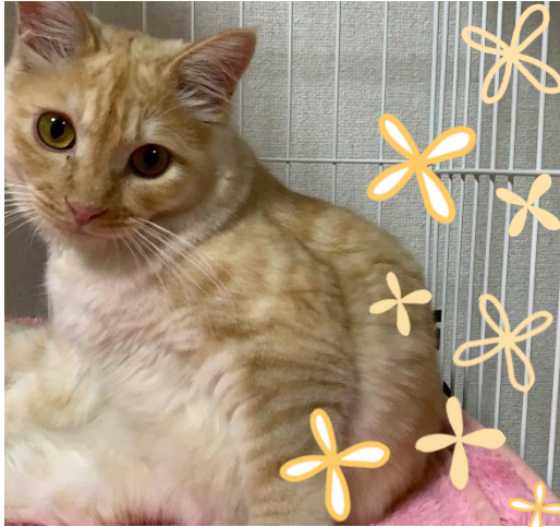
山ノ内3号棟 保護猫 雫 (しずく) くん

グループホームコンパスでは保護犬・保護猫などを引き取り、障がい者グループホームで家族として一緒に暮らします。殺処分ゼロへの取り組みであると同時に、そこで暮らすご入居者（障がい者）の方にとってはアニマルセラピー的な効果をもたらし、温かい優しさにあふれた毎日を実現します。