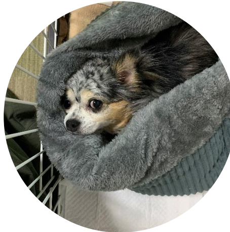
山ノ内2号棟 保護犬 ココちゃん