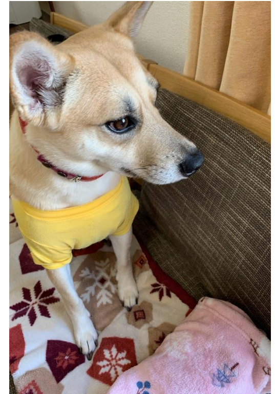
山ノ内1号棟 保護犬 アクアちゃん

グループホームコンパスでは保護犬・保護猫などを引き取り、障がい者グループホームで家族として一緒に暮らします。殺処分ゼロへの取り組みであると同時に、そこで暮らすご入居者（障がい者）の方にとってはアニマルセラピー的な効果をもたらし、温かい優しさにあふれた毎日を実現します。